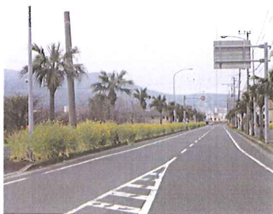
メディポリスから指宿市街と魚見岳を望む 遥かに対岸の大隅半島が見えます