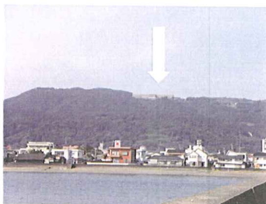
メディポリス 重粒子ガン治療研究センター 指宿の山上にある