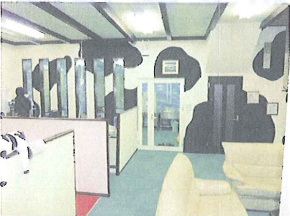
お約束通り 壁の一部はホルスタイン柄!