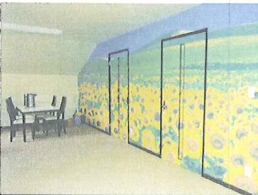
二階には新人居住スペース 壁紙の「ヒマワリ」が否応なしにテンションを高めてくれる