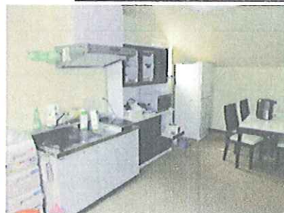
新人居住スペースにあるダイニングキッチン 男二人(禁断の)新たな生活がスタートする