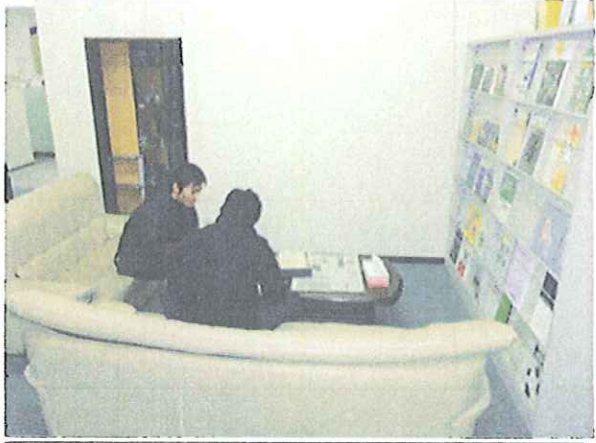
先輩が後輩にやさしく指導(?) 図書談話スペースにて