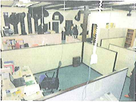
左:事務所内は各獣医師ごとにブースで仕切られている